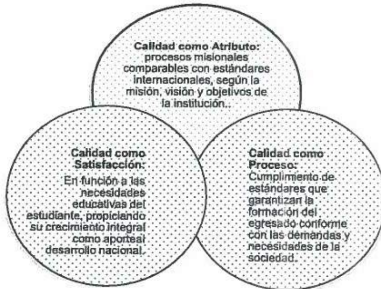
Figura 3. Criterios de calidad