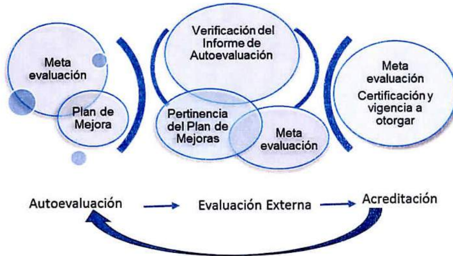
Figura 1. Fases del Modelo de Acreditación universitaria.

El proceso descrito es cíclico, con periodos de vigencia de acreditación de hasta seis años, tras la cual, a la luz de los cambios acontecidos en el contexto externo e interno, se da inicio a un nuevo ciclo de evaluación continua de la calidad en la referida universidad evaluada.